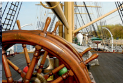
v.l.n.r.: © Nils Bergmann; © LTM S.E. Arndt