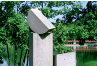
l.u.r.: © Stadt Reinfeld